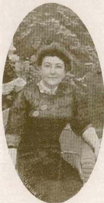
† Mrs. WOODROW WILSON