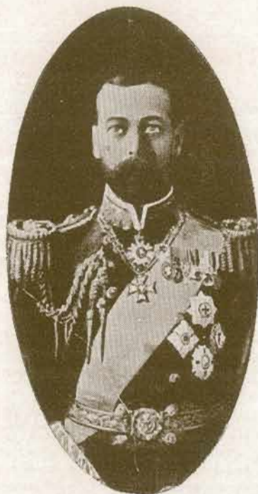
REY JORGE V