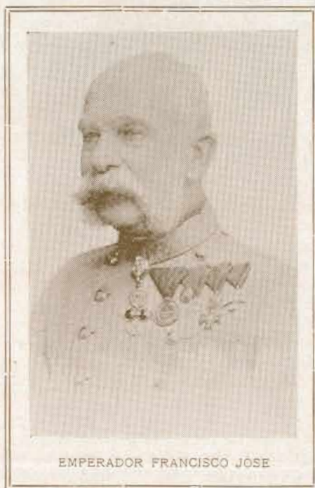
EMPERADOR FRANCISCO JOSÉ

En dos tercios de siglo, la personalidad de Francisco José ha intervenido en los acontecimientos históricos de