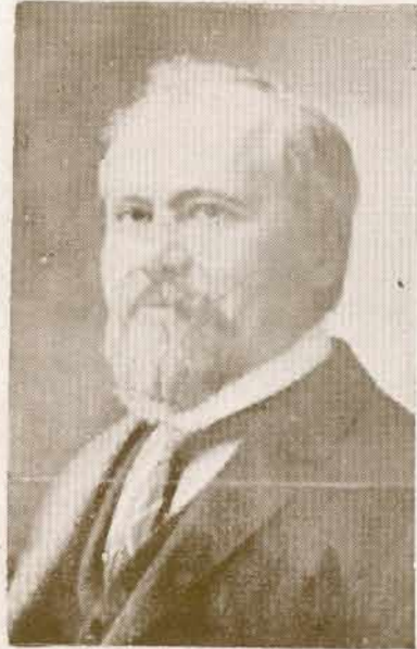
MR. RAYMOND POINCARÉ.

Presidente de la República Francesa, estadista de fama mundial; nació en Bar-le-Duc en 1850. Es abogado. Fue electo miembro de la Cámara de Diputados en 1887. Desempeñó el Ministerio de Instrucción Pública bajo el primer Gabinete Dupuy (1894); fué Ministro de Hacienda; y nuevamente Ministro de Instrucción Pública en el Gabinete Ribot, en 1895. Es un leader de los Republicanos moderados y desde 1903 ocupó con general aplauso un asiento en el Senado, que dejó temporalmente para tomar parte en el Gabinete Sarrien (1906) como Ministro de Hacienda, volviendo luego a sus funciones de Senador, que desempeñaba cuando fué electo por inmensa mayoría para la Presidencia de la República, de la que se hizo cargo el 18 de febrero de 1913. Monsieur Poincaré unirá su nombre a la suerte que Francia corra con motivo de la actual guerra europea, uno de los acontecimientos históricos de la mayor trascendencia en la vida política de aquella gran nación.