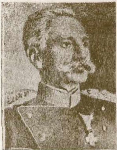
REY PEDRO DE SERBIA

Nació en Belgrado el 29 de junio de 1844. Ascendió al trono el 2 de junio de 1903, después de la extinción de la dinastía de los Obrenovitch. Pertenece a la antigua casa de los Kara-Georgevitch. Contrajo matrimonio en Cettigné, el 11 de agosto de 1883, con Zorka Lioubitza Petrovitch-Niégoch, Princesa de Montenegro. Su hijo el Príncipe Jorge, nacido en Rieka el 27 de agosto de 1887, renunció a sus derechos y prerrogativas de Príncipe heredero el 15 de marzo de 1909 y en consecuencia esa calidad de sucesor pasó al segundo hijo, el Príncipe Alejandro, nacido el 4 de diciembre de 1888, quien se ha hecho cargo del trono en estos últimos días, no se sabe con certeza si por abdicación del Rey Pedro o mientras dure la ausencia de éste, motivada por su determinación de ponerse al frente de su ejército, como Generalísimo, en la actual guerra contra el Austria.