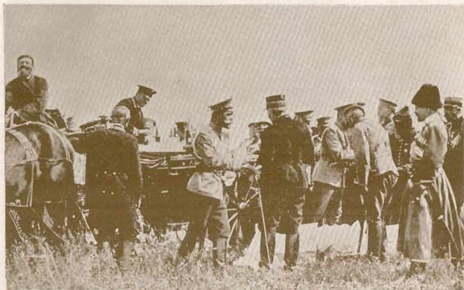
EL EMPERADOR DE RUSIA NICOLAS II

Ha hecho bien el gobierno del Perú, y por ello merece las congratulaciones de todos los admiradores de don Ricardo Palma, que son legión en todo el mundo.